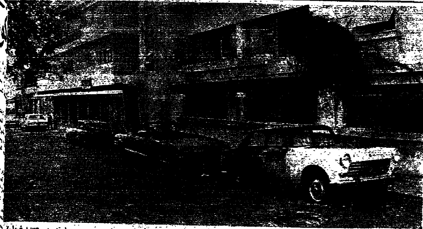
سيارات امسيت خلال ليلة الرعب في بيروت